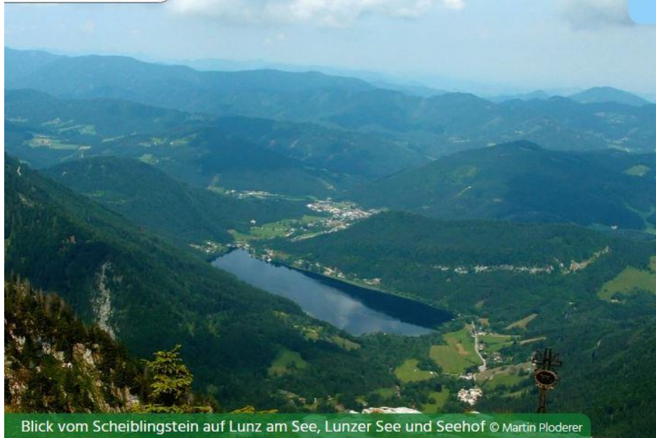
Blick vom Scheiblingstein auf Lunz am See, Lunzer See und Seehof